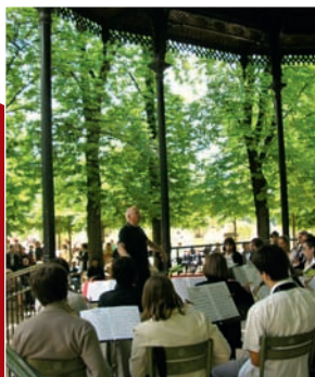
Concert au jardin du Luxembourg