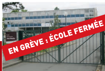
École fermée pendant les grèves