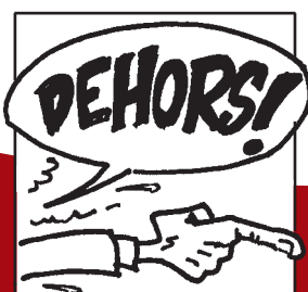
Exclusion à la Maison de l'amitié