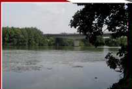
Un pont sur la Seine ouvert aux voitures